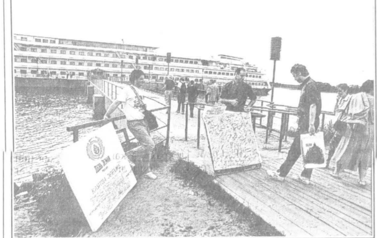
Канадские экологи собирают подписи под «Клятвой Земли» (национальный парк «Русский Север») в городах Череповец, Тула, Углич, Елец, Арзамас-16 (Саров)...