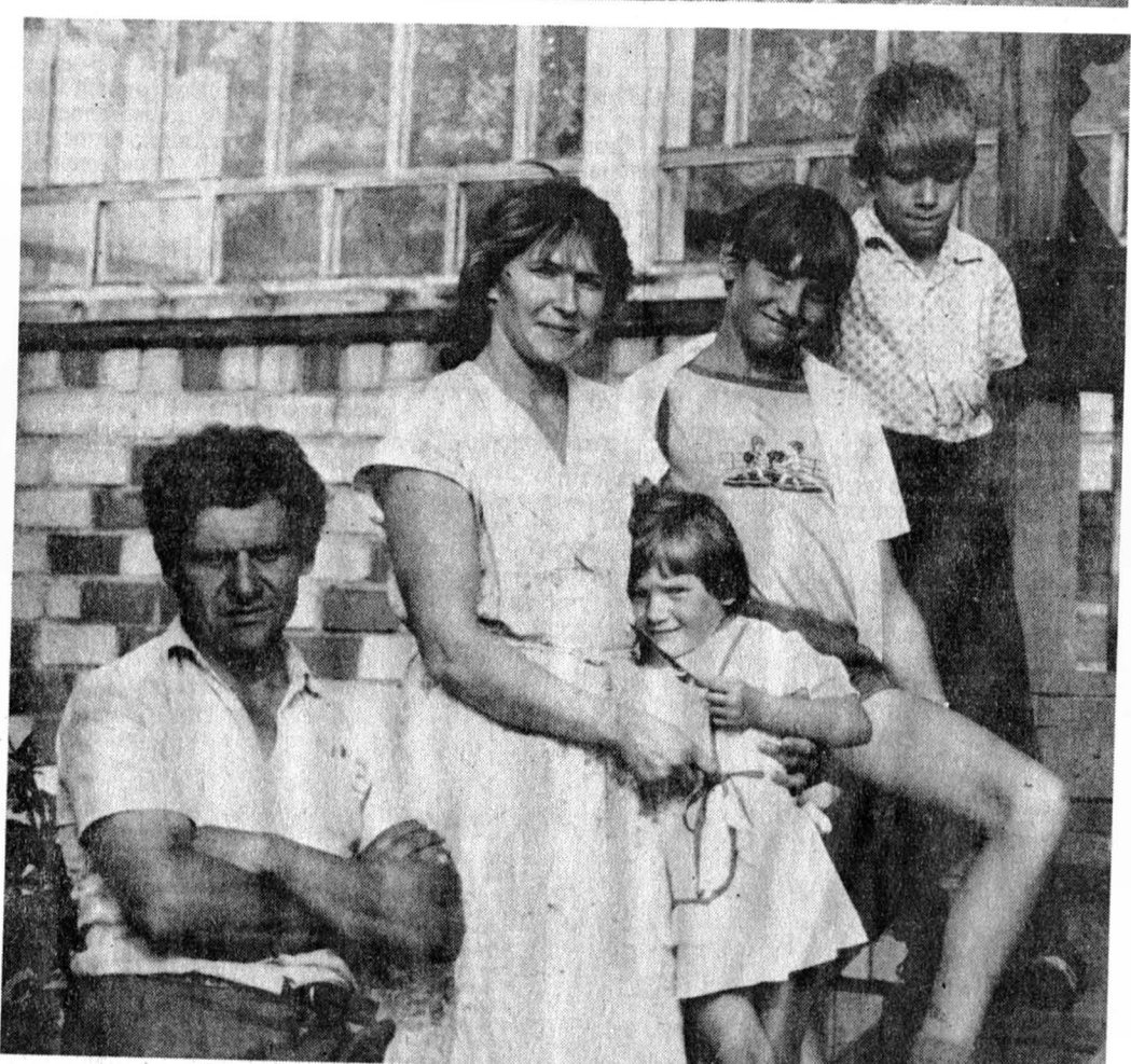
Ярославская область.

В Дубках, на центральной усадьбе народного предприятия «Север», уже передано в личное владение более семисот квартир и индивидуальных жилых домов.