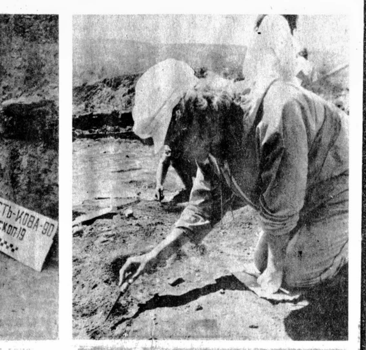
археолог они занимаются делом огромной важности, сомневаться не приходится.