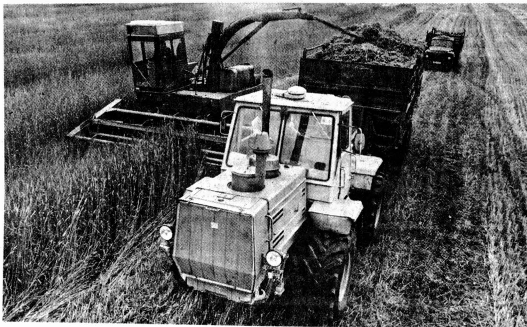
На полях страны.