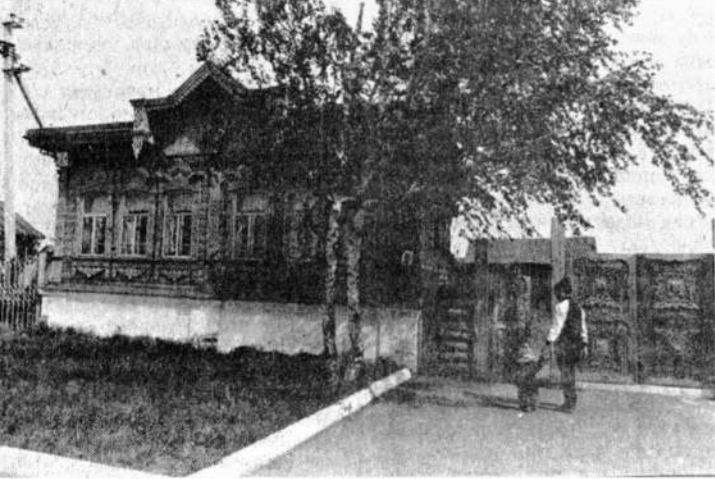
ЦЕНТР ДОСУГА ОМСКАЯ ОБЛАСТЬ. В центре поселка Большеверье в доме с резными наличниками расположился, привлекая к себе местных жителей и туристов, центр досуга «Сибирская старина». Здесь всегда рады гостям — и целебным чаем напоит, и расскажут о народных традициях рукоделия, и покажут старинные ткацкие станки в работе. Центр не только принимает экскурсантов, но и реализует уникальные работы местных мастеров: коври, вышивки, кружево, изделия резчиков по дереву. Можно купить в «Сибирской старине» и горячий калач, выпеченный по бабушкиным рецептам. На снимке: более ста лет дому, в котором разместились центр.

Программа телевидения России 11.30 — Ленинградская студия документальных фильмов показывает... 12.30 — Молодые исполнители. 12.50 — Камера исследует прошлое. 13.30 — Мультифильм. 16.00 — Теннис. Уимблдонский турнир. 17.00 — 19.00 Программа телевидения России 17.00 — Грани. 18.00 — «Редькины вызвали!». 18.15 — «Солидарность». 18.45 — Парламентский вестник России. 19.00 — Футбол. Чемпионат СССР. ЦСКА — «Шахтер». Впервые (19.45) — Вести. 20.45 — «Спокойной ночи, малыши!». 21.00 — Время (с супертрансляцией). 21.40 — 23.40 Программа телевидения России 21.40 — На сессии Верховного Совета РСФСР. 22.10 — Театральный развезд. 23.00 — Вести. 23.15 — «Ами-экспресс». 23.30 — «Взгляд» из подполья. 23.40 — Тел. музыкальный абонемент ОБРАЗОВАТЕЛЬНАЯ ПРОГРАММА. 19.00 — Детский. 20.00 — «Бурда модная»... 20.30 — «Прометей». Фильм-балет. 20.55 — Испанский язык. 1-й год. 21.25 — Испанский язык. 2-й год. 21.55. 22.40 — «Под знаком ела». 22.25 — «Мир увлеченных». МОСКОВСКАЯ ПРОГРАММА. 7.00 — «2х2». 19.00 — Понорама Подмосковья. 20.00 — «Спокойной ночи, малыши!». 20.15 — Добрый вечер, Москва! 23.45 — «Осенние утреники». Худ. телефильм. 1-я серия. 0.50 — «Поющие в хоре».