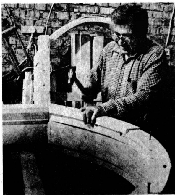
На снимках: своими силами возводит молитвенный дом красноярские христиане - баптисты.