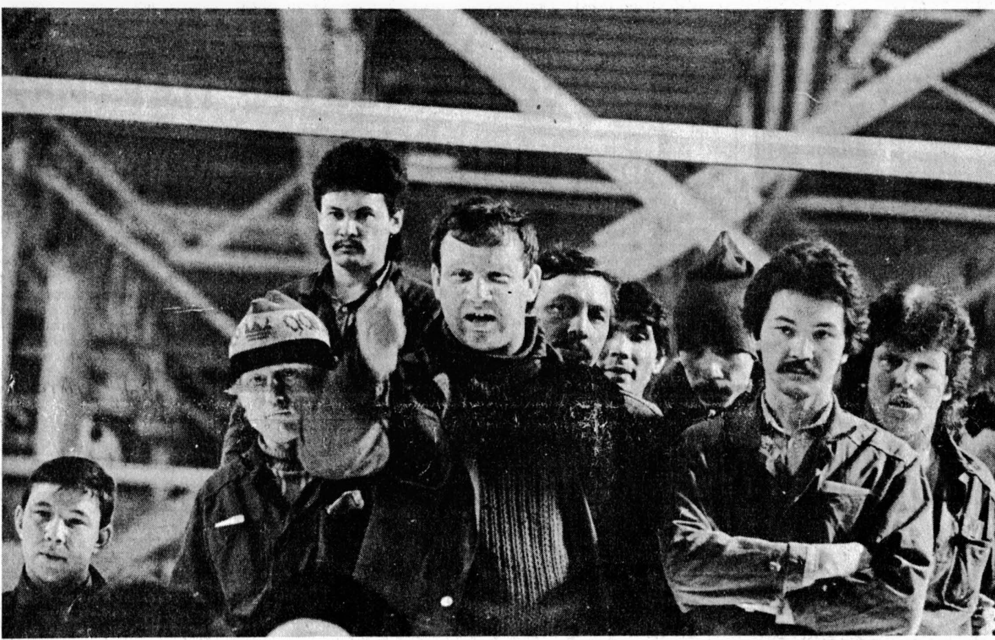
А мы так думаем...