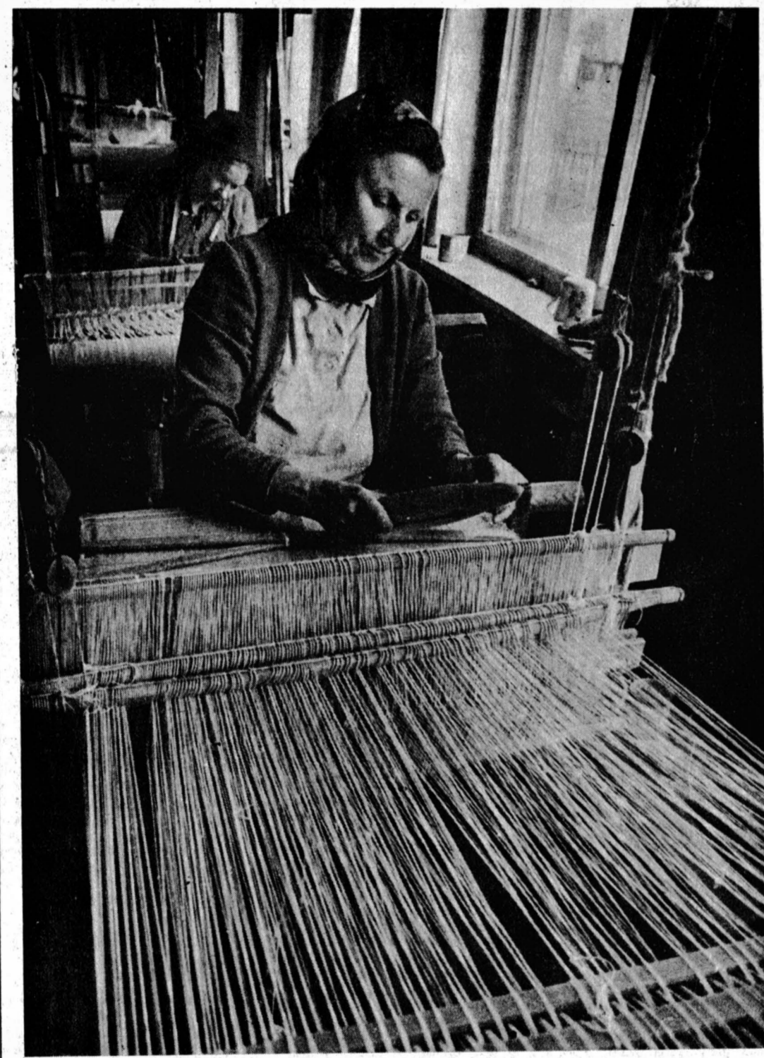
Живы народные промыслы.