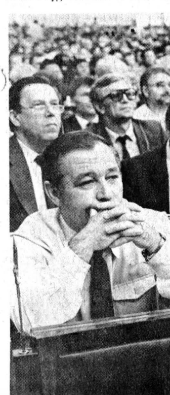
В зале заседаний Съезда.