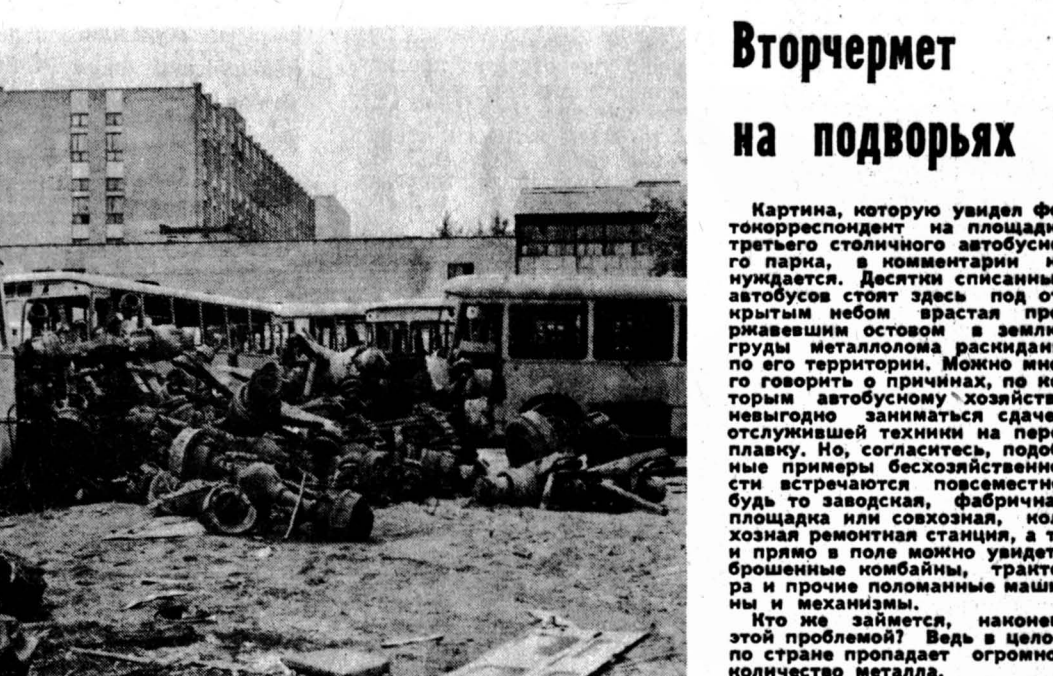
НА СНИМКАХ: на площадке третьего столичного автобусного парка.