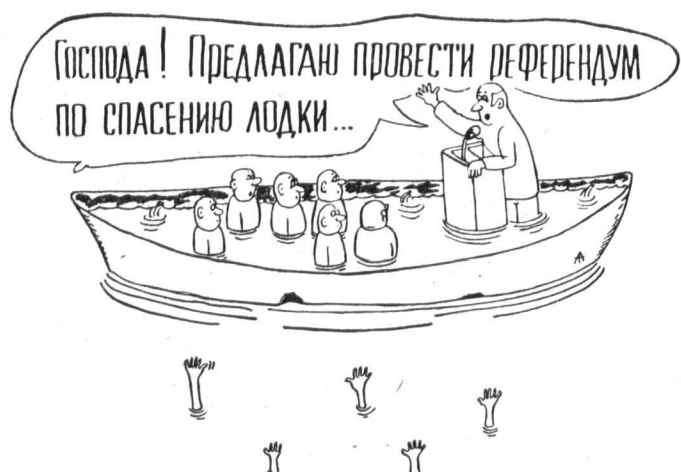
Рис. Анатолия ТАЛИМОНОВА.

ну, необходимо будет уплачивать пошлину. Но означает ли мнение горожан — необходимость его называния сельчанам? Вряд ли. Есть еще и зарождающийся класс предпринимателей. Кто преобладает в его естественном интересе к купле-продаже земли? Возможность развивать производство сельхозпродукции? Таких примеров единицы. В нынешних условиях всеобщей нехватки вкладывают деньги в производство, при этом разбалансированности денежно-финансовой системы — земля для них в первую очередь «хранилище» капитала, еще одна возможность наращивания своего богатства. Социальная сторона дела в вопросе о земле сливается с экономической, и купля-продажа ее лишь в незначительной мере может стимулировать производство. Земля обладает высокой устойчивостью к отчуждению при купле-продаже. Поверяя владельцы земли и наемные работники. Для обеспечения постоянства технологического процесса нет необходимости регулярного повторения актов купли-продажи. Высокая цена земли неизбежна в наших условиях. Много ли фермеров могут купить землю? Примеры есть, но они не делают погоды. Дело не в правовых ограничениях, а в неадекватности экономических и социальных условий. Лишь 20 процент фермеров называют трудность получения земли торгом своего развития. Этот