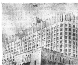
Парламентский обозреватель «Российской газеты» передает из Белого дома.

Совместное заседание 24 декабря депутаты начали с рассмотрения законопроекта «Об увековечении памяти погибших при защите Отечества». Во время обсуждения законопроекта, касающийся изменения и дополнений в Кодекс РСФСР об административных правонарушениях, Уголовный и Уголовно-процессуальный кодексы России, об административной ответственности за нарушение правил дорожного движения, после обсуждения в парламенте в ноябре был возвращен президентской же стенограммой. Ее замечание сводилось к тому, что подобные меры ответственности должны устанавливаться не только федеральным органом, но и субъекты федерации. Так как четкого разделения путей сообщения на федеральные и прочие пока нет, депутаты сочли эту поправку несущественной и приняли соответствующий закон.