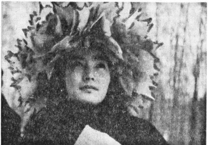
Героиня картины Рин Ямадита, принявшая после крещения имя Ирина, — реальное историческое лицо. Эта одаренная художница прошлого века изучала в Петербурге иконопись, а также заглядывала в залы Эрмитажа. В фильме ее играет молодая актриса Секо Иджичи.

Русская духовная история оказалась притягательной и для японцев: токийский режиссер Родо Седзи представляет на суд зрителей столичный Дома кино свой новый фильм «Рин. Легенда об иконе».