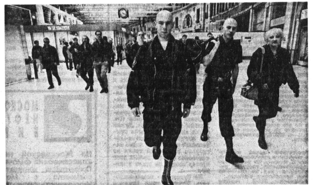
Преступления немецких неонацистов вызвали волну протестов во многих столицах мира. Но крайние правые активизируют свою деятельность не только в Германии, а и в других странах Европы. На снимке: бритоголовые в Лондоне.