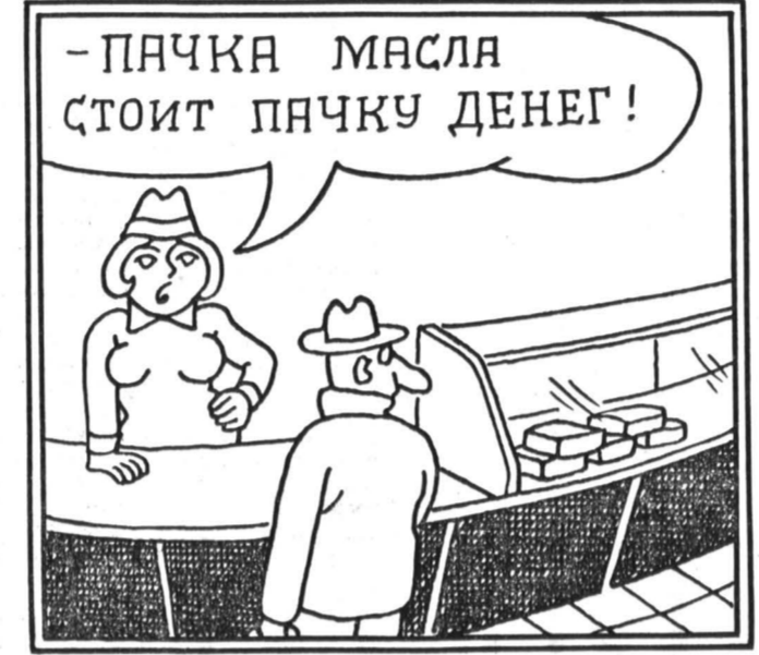
Рис. Марка КАШИРИНА.