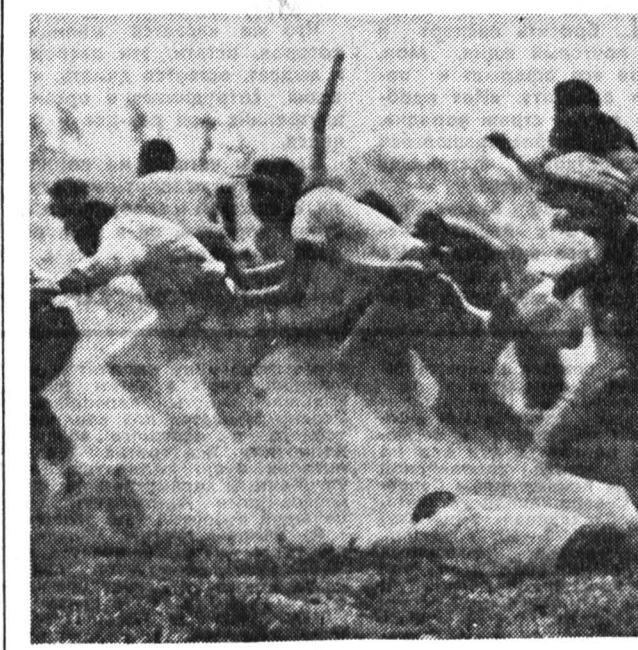
Дорога к будущей демократической Южной Африке вымощена не одними благими намерениями правительства президента Фредерика де Клерка поделится властью с партиями и организациями, представляющими интересы чернокожего большинства населения этой страны. В последнее время обострилась борьба за эту самую власть между различными политическими группировками. Всплеск насилия и стрельбы зачастую ее прямым следствием. А жертвами становятся в основном далекие от политических страстей и амбиций люди. Как эти (на снимке), вольно или невольно участвовавшие в марше на Бантустан Сисей (одно из псевдознаменитых государственных образований на территории ЮАР), который недавно организовал Африканский национальный конгресс. Во время этого выступления произошла перестрелка между демонстрантами и силами безопасности Сисей. Кто ее спровоцировал, до сих пор выяснить не удалось. Стороны обвиняют друг друга...