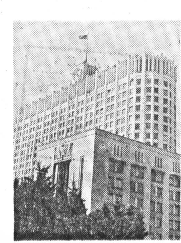
Парламентский обозреватель «Российской газеты» передает из Белого дома.

«Президент и парламент — это единственные пока что властные структуры, которые имеют опору в нашем обществе», — заявил 21 октября Руслан Хасбулатов, открывая совместное заседание палат российского парламента.