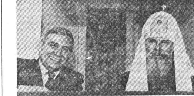
На концерте присутствовали министр культуры Е. Сидоров и Патриарх Московский и всея Руси Алексий II.

Вчера в Москве состоялся концерт духовной музыки, посвященный 600-летию преставления Сергия Радонежского.