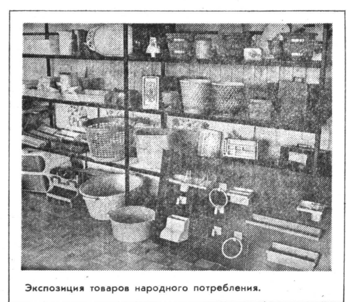
Экспозиция товаров народного потребления.