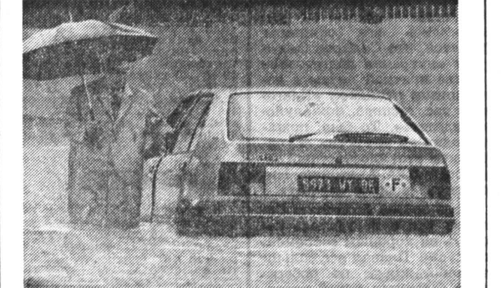
Продлившие дожди не прекращаются во Франции. На снимке: наводнение в Ницце.

ЗА НЕИМЕНИЕМ БАНАНОВ ОБЕЗЬЯНЫ ОХОТЯТСЯ НА КУР САМАЯ СИЛЬНАЯ ЗА ПОСЛЕДНИЕ 50 ЛЕТ ЗАСУХА КОТОРАЯ ПОРАЗИЛА В НЫНЕШНЕМ ГОДУ СТРАНЫ ЮГА АФРИКИ ПРИНЕСЛА НЕИСЧИСЛИМЫЕ СТРАДАНИЯ. НЕ ТОЛЬКО ЖИТЕЛЯМ РЕГИОНА, НО И ДИКИМ ЖИВОТНЫМ.