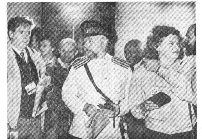
В Санкт-Петербурге продолжает свою работу второй Конгресс соотечественников. На снимке: участники и гости конгресса в Таврическом дворце.

Полномочные представители внешнеполитических ведомств государств Содружества (Азербайджан присутствовал в качестве наблюдателя) обсудили повестку дня предстоящей встречи в верхах 25 сентября в Бишкеке, вопросы координации и взаимодействия на предстоящей 47-й Генеральной Ассамблее ООН в Нью-Йорке. По мнению министра иностранных дел России Андрея Козырева, для встречи было характерно отсутствие каких-либо политических разногласий по всем обсуждавшимся вопросам.