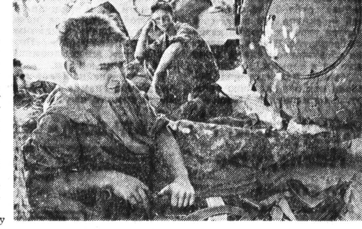
Третий день не прекращается кровопролитное столкновение между двумя противоборствующими вооруженными группировками...