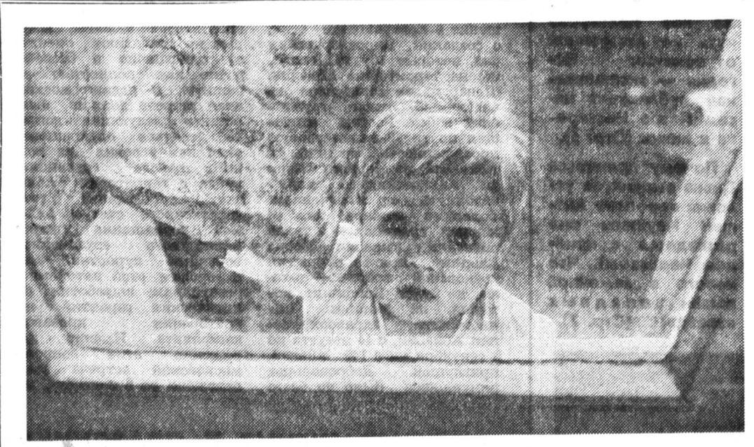
Рынок — это новый образ той жизни, в которой дети делают первые шаги, глядя на мирными глазами. Что отразится в них? Сейчас все чаще — кричащие контрасты. Дети, выспавшиеся марин-доллары, например. Такой вот новый образ жизни. Что же, да поможет рынок, но и да не оставит их Бог...

Впрочем, и на заседании малого Совета, и на сессии говорилось о том, что в постановлении главы администрации есть и здравые положения. Например, что будет возмещать против того, чтобы после ослабления конфликта в Абхазии предотвратить ввоз оружия на Кубань? Эти меры уже принимаются внутренними войсками, пограничниками, но они должны быть узаконены.