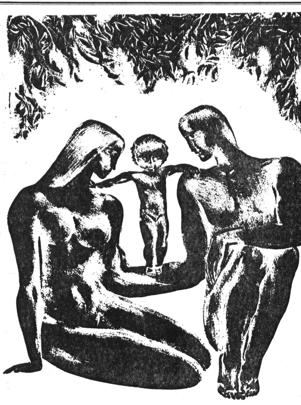
Литография Стасиса КРАСАУСКАСА.

общества. Дети — наше будущее». Дежурность и обязательность этих деклараций начинала и исчерпывала тему. На деле же семейная, личная жизнь человека всегда была у нас фактором незначительным, неуважаемым. И все эти требования о недопущении разводов, что означало якобы борьбу за незапятнанный моральный облик, только подтверждали этот принцип неуважения к личности. Высокомерное пренебрежение, закамуфлированное лицемерными лозунгами — таким было буквально до последнего времени отношение к семье в любой деловой сфе-