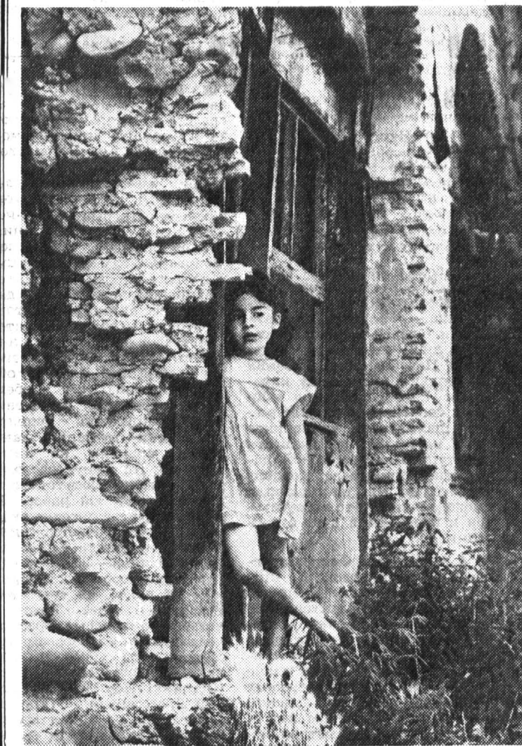
На снимках: о чем думают эта лишившаяся в пять лет отца девочка у разрушенного дома на улице Цхинвала и пожилая женщина из села Гром?

Александр АЛЕШКИН, соб. корр. Владикавказ — Цхинвал.