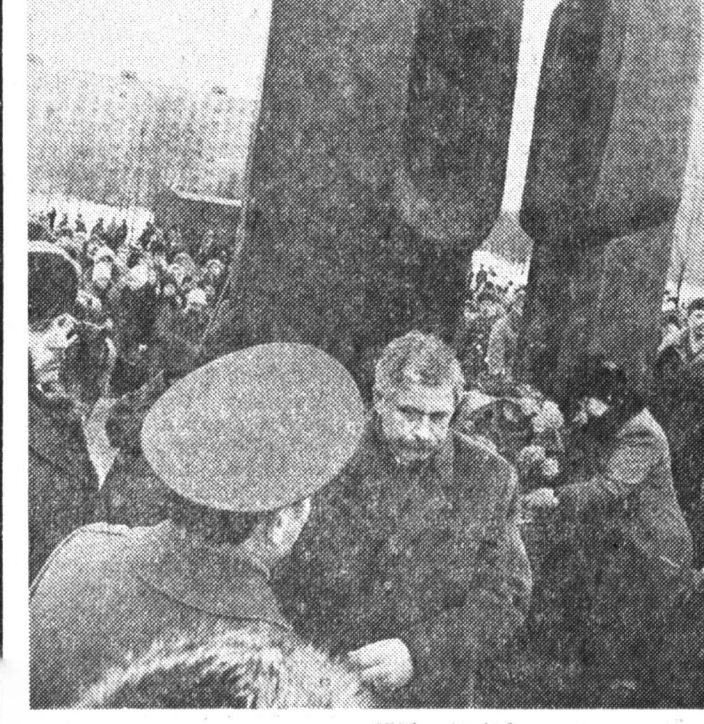
Открытие памятника героям «афганцам» в феврале этого года.

Музей Вадима Сидура расположен в московском районе Перово в пристройке к жилому дому. Творчество этого скульптора, художника, поэта — предмет особого разговора. Однако музей Вадима Сидура — это не только