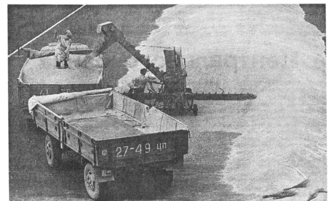
продавать по 24—25 рублей за килограмм», — говорит один из руководителей крупного хозяйства Ставрополье, не давший согласия на публикацию своего имени.