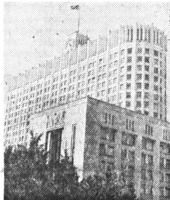
Парламентские обозреватели «Российской газеты» передают из Белого дома.