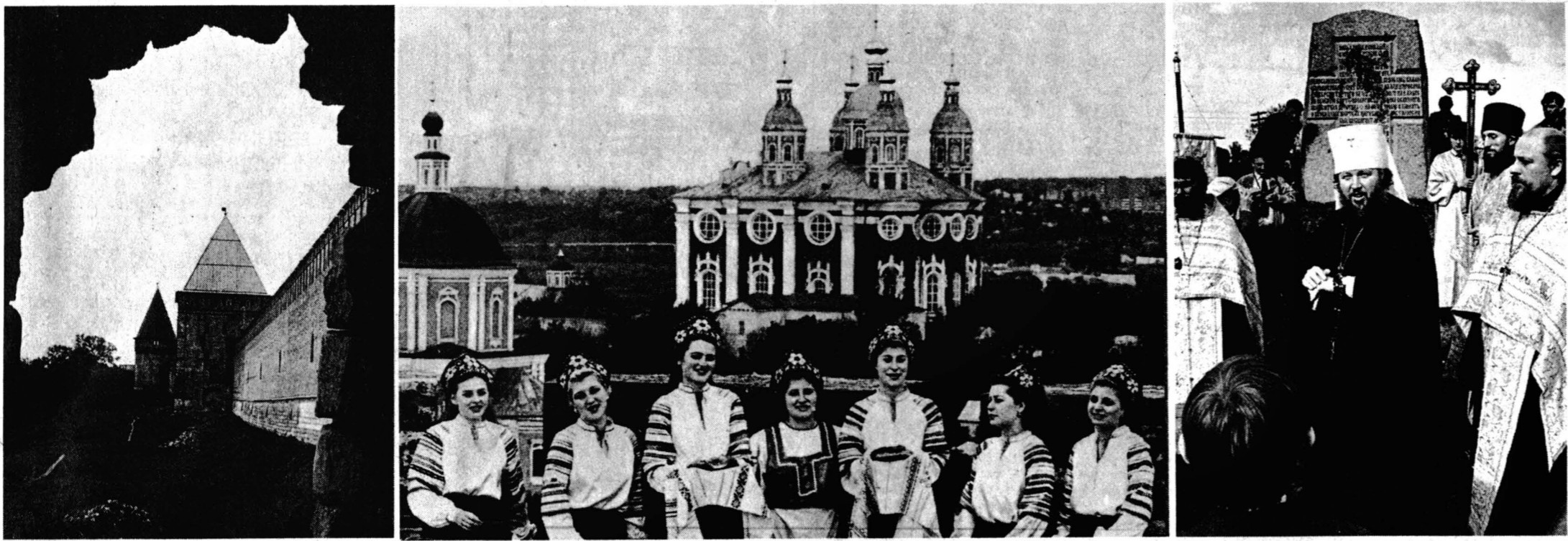
Крепостная стена в Смоленске. На фоне Успенского кафедрального собора. Митрополит Смоленский и Калининградский на открытии памятного знака на Смядыне.