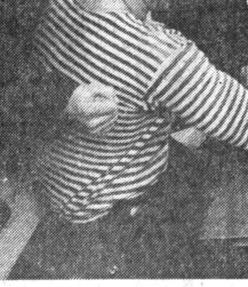
Возрождение Школа коммерсантов — новая ступень

Проблема с еврейскими рукописями, находящимися в Российской государственной библиотеке, наконец-то решается с помощью современных методов.