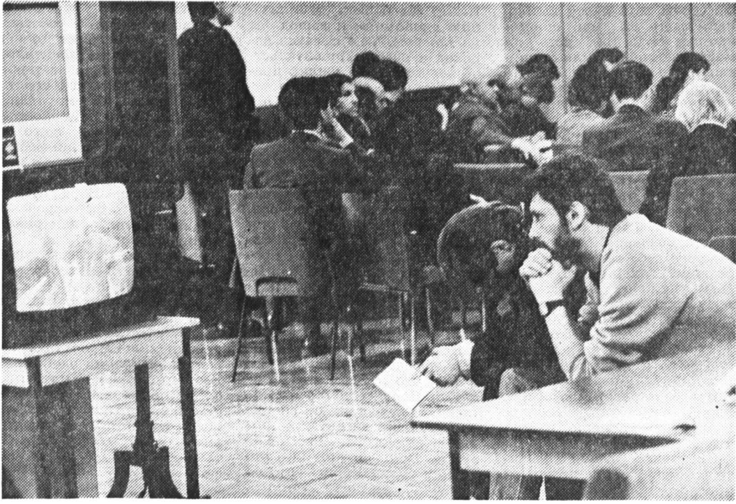
В пресс-центре Съезда.