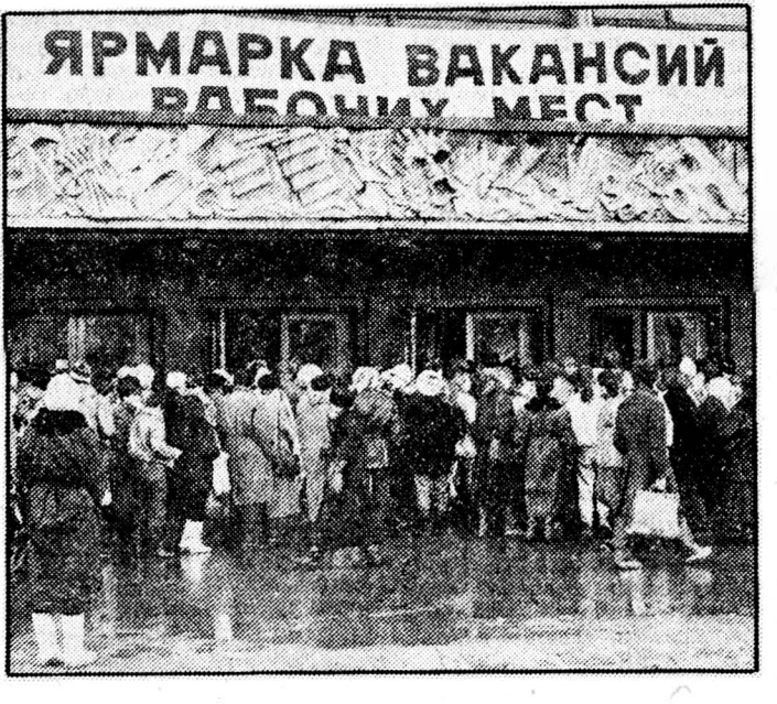
В городе на Неве молодежная биржа труда совместно с комитетом по труду и занятости мэрии провели пока не совсем для нас обычную мероприятие — ярмарку вакантных рабочих мест. Те петербургские безработные, которые пришли на ярмарку, смогли здесь пообщаться с представителями предприятий, заинтересованных в приходе рабочей силы, а наиболее удачливые — и заключить тут же контракты. Всего на ярмарке побывало около 25 тысяч человек.