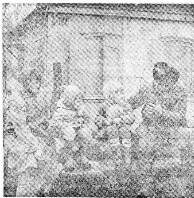
Неспойная обстановка во многих республиках бывшего Союза гонит с насильственными переселениями в Краснодарский край беженцев и ухудшению межнациональных отношений, росту социальной напряженности. Супруги Гигины и их дети — беженцы из Узбекистана. Им повезло: в столице Рогоской Тимашевской района купили домик, получили участ-