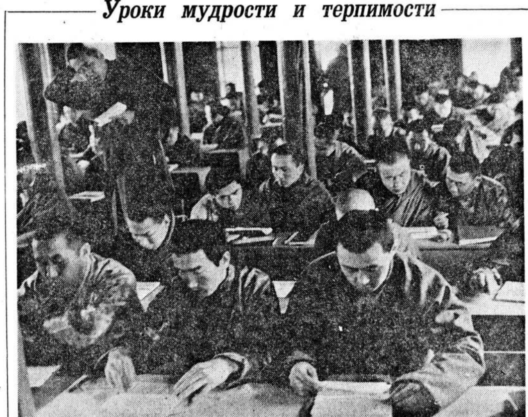
Приобщение к оживленным истмам, к духовности...

«Да вы что, какой из меня националист...»