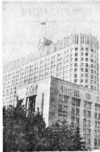
Парламентские обозреватели «Российской газеты» передают из Белого дома.

Как уже сообщала «РГ», группа народных депутатов России обратилась в Конституционный суд с просьбой рассмотреть их ходатайство о спорных местах некоторых документов, принятых Верховным Советом Татарстана. 12 марта началось рассмотрение этого вопроса в Конституционном суде.