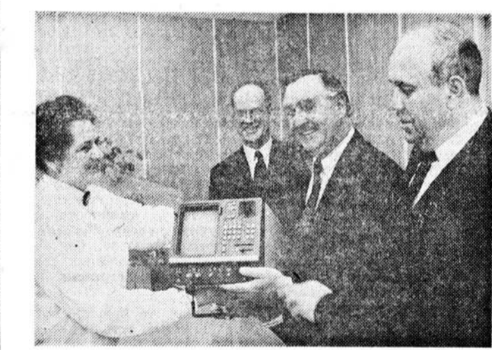
Уникальный медико-диагностический прибор фирмы «Синем» стоимостью в 75 тысяч долларов привезли в подарок детям Москвы члены парламентской делегации округа Шпандау — Берлин. Гости передали дар диагностическому центру детской поликлиники № 110 Северо-Восточного округа столицы. Контакты между двумя округами Берлина и Москвы установлены совсем недавно. Их глава берлинской делегации бургомистр округа Шпандау В. Саломон верит в их устойчивое будущее.