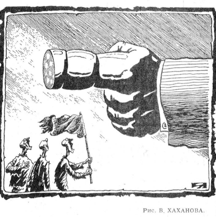
Рис. В. ХАХАНОВА.

может быть меньше 250 млрд. рублей. Разве эти цифры обнаружатся впервые и люди о них не слышали? Но тогда они понимают, что грош цена тем гарантиям и уж совсем не за что благодарить правительство, ввергшее страну в пучину кризиса. И еще один штрих: если уж говорить нечестно, так давайте вспомним: нынче тяжесть социальных программ правительство охотно перекладывает на плечи республик. Более того, о малообеспеченных начинают заботиться не только республики, но также города и районы, тратя на это свои не столь уж великие средства. Так что утверждение «агитки», что «при распаде Союза республики не смогут гарантировать получение пенсий в прежних размерах», а то и вовсе не будут их платить, абсолютно не на чем не основано, не скреплено никакими расчетами. Я уже не говорю о том, что фигурирующий всоуду распад Союза», которым нас пугают, олять же ни о чем не говорит. Какой распад — экономический, политический, окончательное обособление и разрыв всяческих связей? Это так же смутно, как и «обновление Союза» непонятно под каким соусом. Заканчу эти размышления самой циничной фразой, не требующей никаких комментариев. «Если ты говоришь «нет Союзу», значит, ты... обрекаешь стариков на нищету!». Уму непостижимо! Елизавета ЛЕОНТЬЕВА.