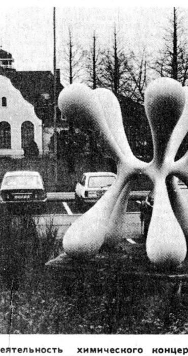
Так скульптор видит деятельность химического концерна «Байер», перед административным зданием которого в Левенузене установлено его творение.

Магазины Потсдама теперь, как в Дюссельдорфе. А зарплата на востоке втрое меньше.