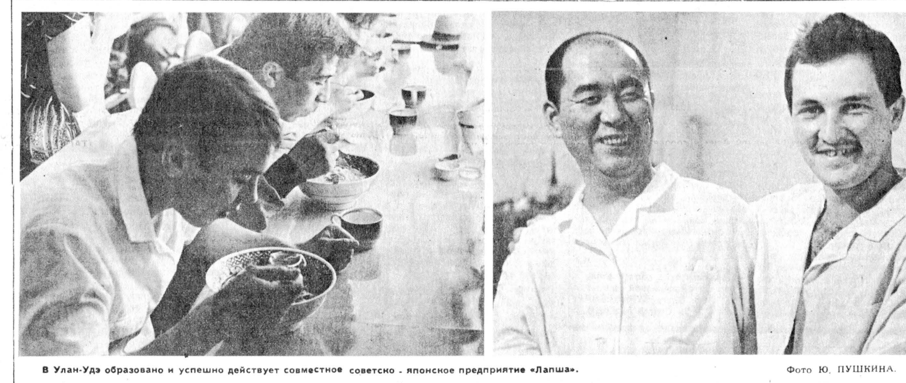
В Улан-Уде образовано и успешно действует совместное советско-японское предприятие «Лалша».