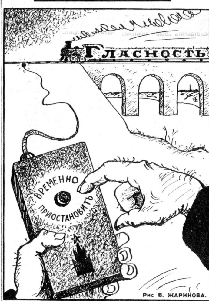
Рис В. ЖАРИНОВА.