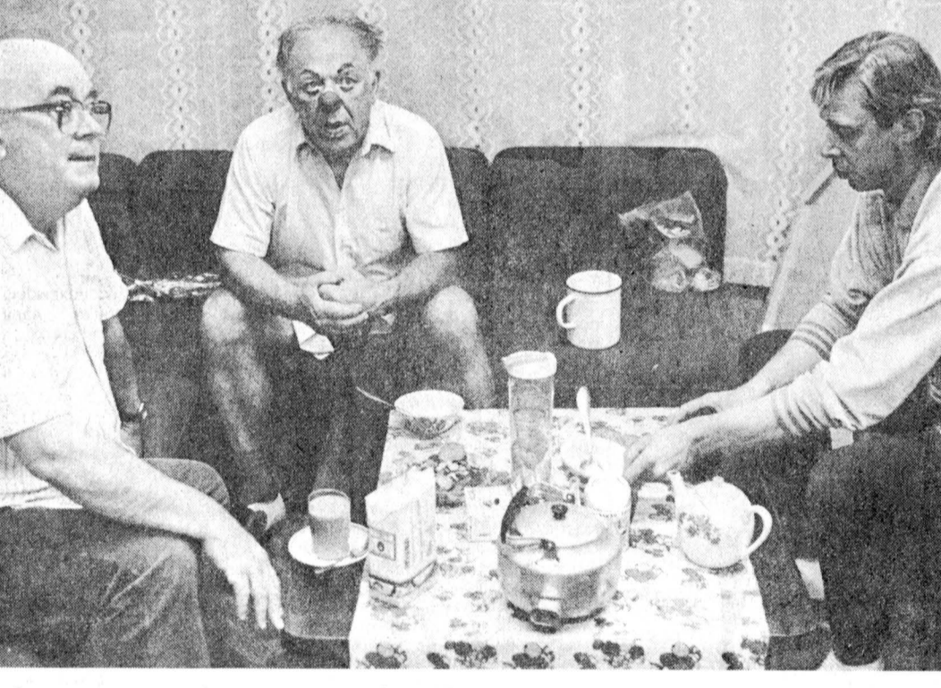
В гостях у знаменитого клоуна Олега Попова.

«Слово о большом художнике». 17.25 — Мультифильм. 17.35 — Кинофильм Марусин. 18.10 — «Эти старые, старые старые ленты...». 19.15 — «Большой фестиваль». 19.30 — Телестанция «Факт». 19.50 — Актуальное интервью. 20.00 — «Найдя меня, или Серьезная игра для взрослых». 20.30 — «Телеафиша». 20.45 — Спорт, спорт, спорт. 21.45 — «600 секунд». 21.55, 22.10 — Реклама. Объявления. 22.00 — Ленсовет — прямой эфир. 22.15 — Эфир приключенческого фильма «Вальд». 23.35 — «Визит, или 60 минут с удачей». Программа для молодежи. 0.50 — Телестанция «Факт». 0.50 — «Угрюм-река». 4-я серия.