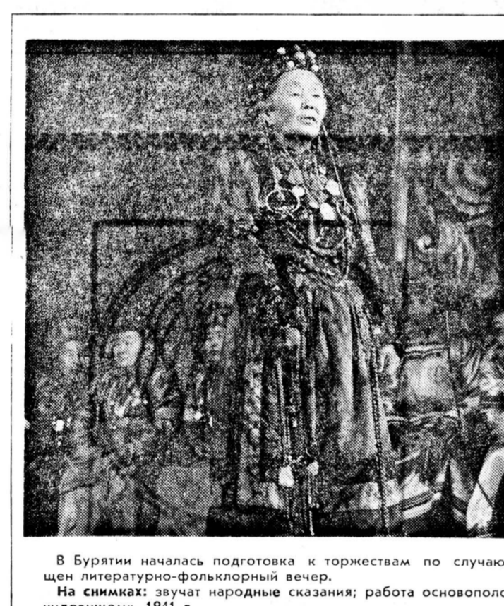
В Бурятии началась подготовка к торжествам по случаю тысячелетия народного эпоса «Гэсэр». Этой дате был посвящен литературно-фольклорный вечер.