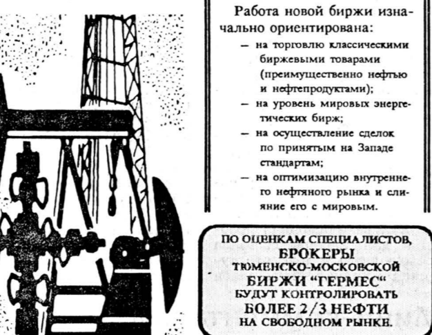
ПО ОЦЕНКАМ СПЕЦИАЛИСТОВ, БРОКЕРЫ ТЮМЕНСКО-МОСКОВСКОЙ БИРЖИ «ГЕРМЕС» БУДУТ КОНТРОЛИРОВАТЬ БОЛЕЕ 2/3 НЕФТИ НА СВОБОДНОМ РЫНКЕ.

К торгам допускаются брокеры бирж: товарно-фондовой, Нижневартговской нефтяной, Сургутской товарно-сырьевой, Кузбасской международной товарно-сырьевой, а также брокеры других бирж Тюменской, Кемеровской и Томской областей.