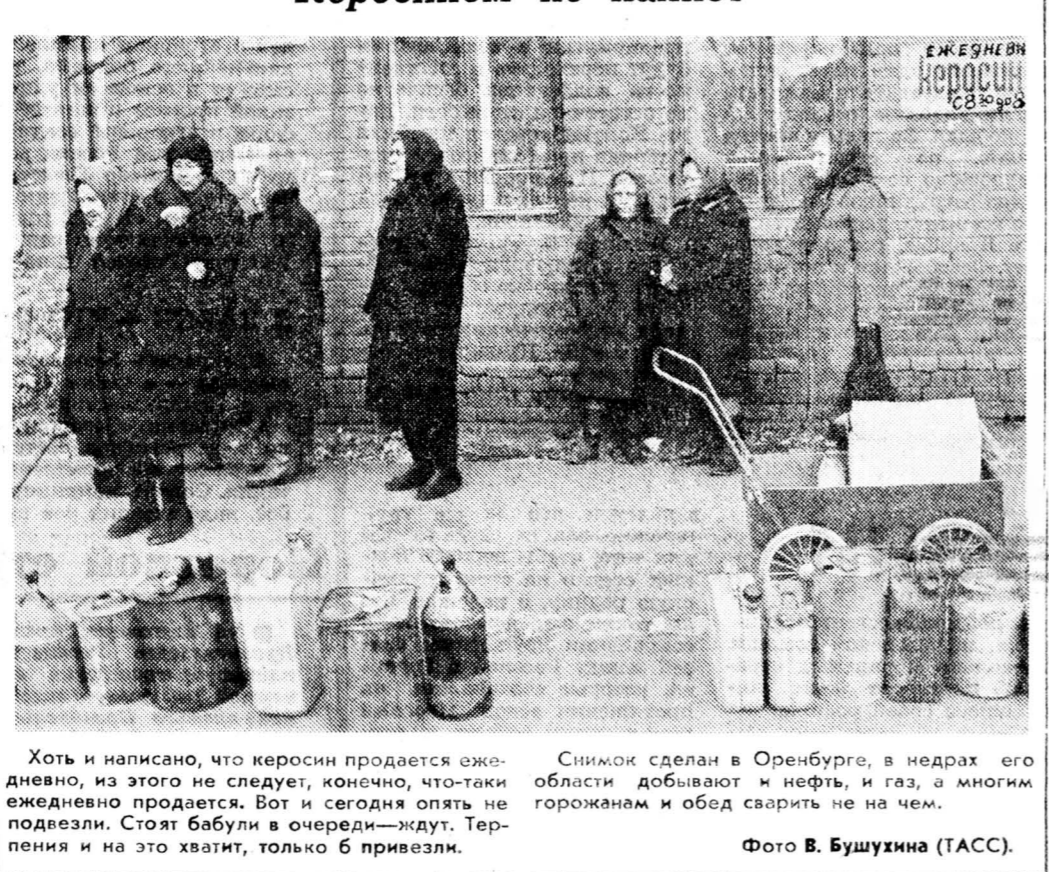
Хоть и написано, что керосин продается ежедневно, из этого не следует, конечно, что керосин продается ежедневно.

де-юре концерн Росуголь, как бы шахтеры ни пытались от него эмансипироваться. Существует объединение ВОРКУТМУЗ, из которого собирается выходить пить крупнейших шахт, но которое с упором опереточного пафа, не желающего примириться с афроном, продолжает инвестировать строящийся в Риге морской порт.