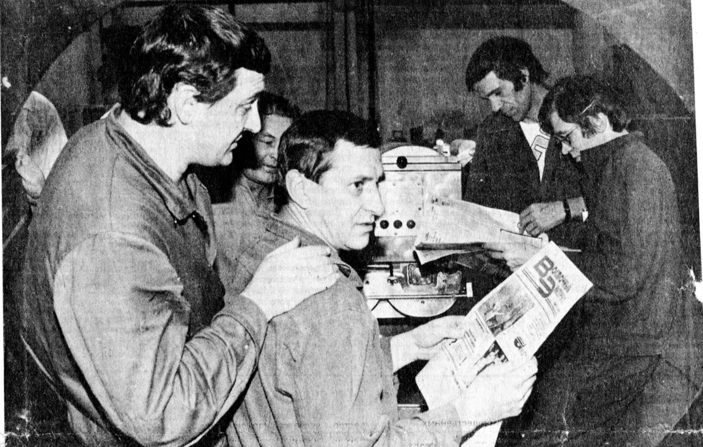
Читателям огромного региона — от Урала до Тихого океана адресован еженедельный «Восточный экспресс», первый номер которого вышел в свет в типографии «Красноярский рабо-

Интервью взял С. КОКОРЕВ, сотрудник общетрасовой газеты «БАМ».