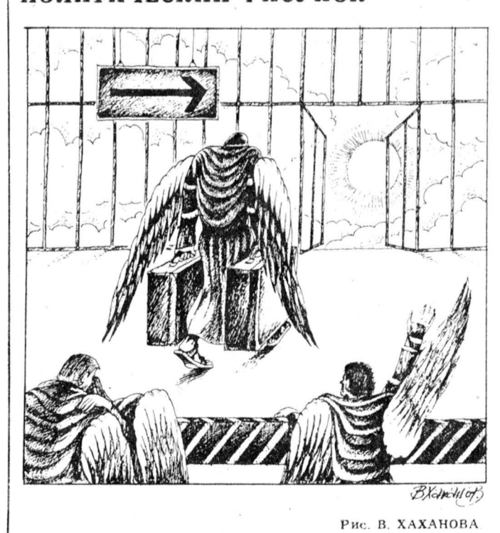
Рис. В. ХАХАНОВА