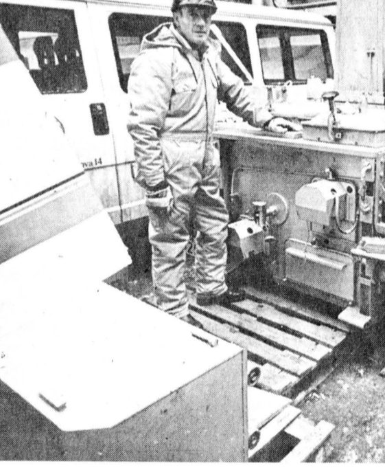
Ю. ШАТАЛОВ, наш соб. корр.

правде сказать, событие неординарное. Кто бывал на Новгородчине до сличного бум, тот прекрасно знает продукцию чудовской фабрики «Пролетарское знамя» — коробок спичек здесь выдает и совсем крохотный, сантиметр на сантиметр в сечении, и больше, нарядным, похожим на коробку конфет.