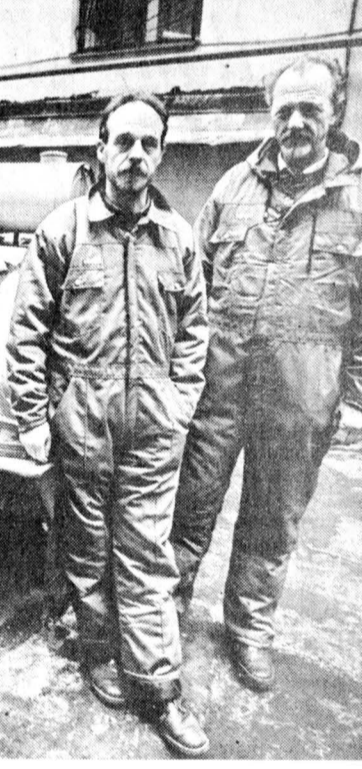
Ю. ШАТАЛОВ, наш соб. корр.

В молодости, путешествуя на байдарке по маленьким российским рекам, я насмотрелся на деревни, где избы были покрыты одним жердями. Солому с криш сели коровы. Мы спорили: нуждаются ли эдакие колхозники, едва сводящие концы с концами, в каком-то социальном идеале или им достаточно порядка, при котором можно загнать сена и покрыть избы жемчужно?