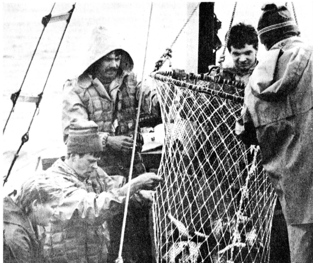
Рыбаки в Северном море.