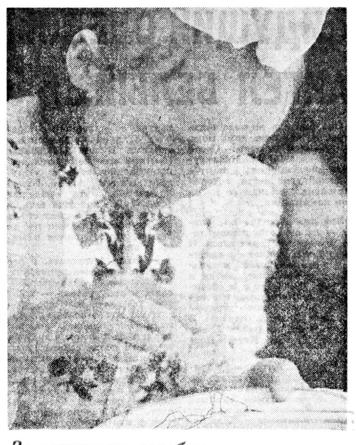
За сохранение самобытных культур

«Бы здесь не спали!» Между тем именно Совмин Якутии не намерен назначать грядущую либерализацию цен в намеченные сроки. Эти сроки, как полагают в правительстве, откладываются на неопределенное время. Освобождение цен как важнейший шаг к рынку здесь рассматривают в комплексе с другими элементами экономической реформы. Полагая, что введение этой меры должна предшествовать разработанная и действующая программа по социальной защите населения, особенно его малообеспеченных слоев. С другой стороны, правительство республики не может не осознавать, что длительная задержка либерализации цен непопулярна, поскольку, во-первых, из старых, то есть выпущенных в обращение, даже алмазной республике долгие не протянуть, и, во-вторых, проводя в этом вопросе свою отличную от всей Российской Федерации политику, Якутия может оказаться в хвосте радикальных реформ. Решено, что конкретные сроки начала либерализации цен на территории Якутии будут определены после утверждения сессией Верховного Совета Якутии республиканского бюджета. Николай БЕЛЫЙ, наш соб. корр. Якутск.