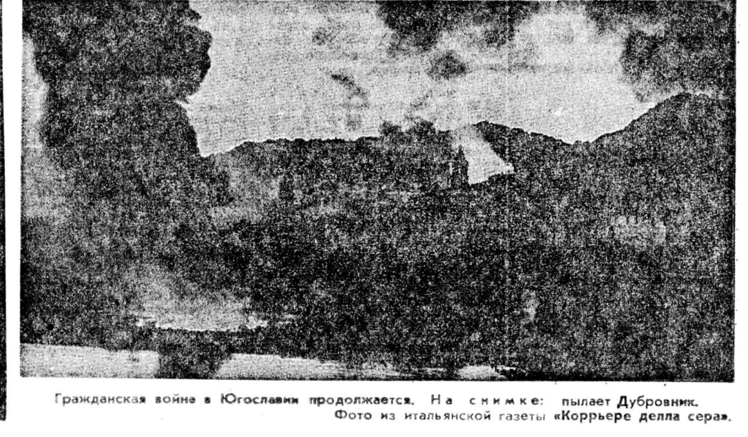
Гражданская война в Югославии продолжается. На снимке: пылает Дубровник.