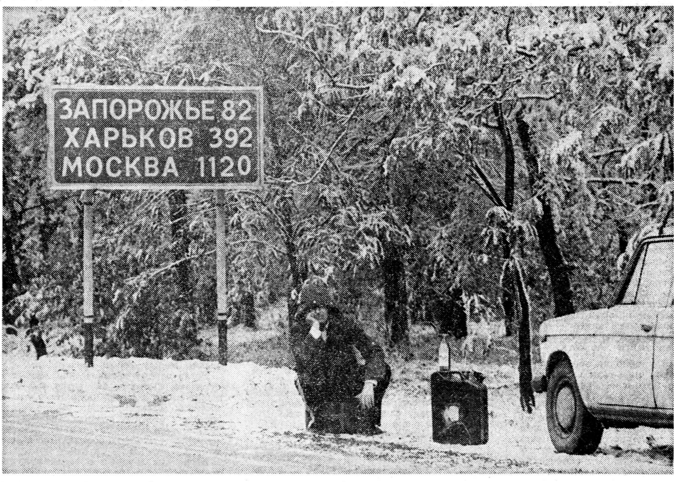
Бартер: меню водку на бензин.