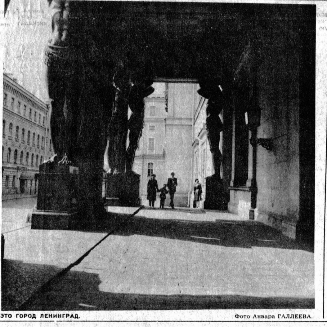
ЭТО ГОРОД ЛЕНИНГРАД.

● РИГА. «Нападения на таможенные пункты и акции военных на улицах Риги — предостережение народу Латвии», — заявил здесь на пресс-конференции в Верховном Совете Латвии председатель комиссии по оборонным и внутренним делам республики Таливалдис Юндзис. Он обвинил в нагнетании напряженности эти круги центра и компартии, которые хотят сохранить империю, и предупредил о вероятности возведения новых баррикад. Министр внутренних дел республики Алоиз Вазис отметил, что прибывшую по поручению министра внутренних дел СССР Бориса Пуго в Латвию комиссию интересовал фактический ход событий, и юридическая обоснованность создания таможенных пунктов. РИА.