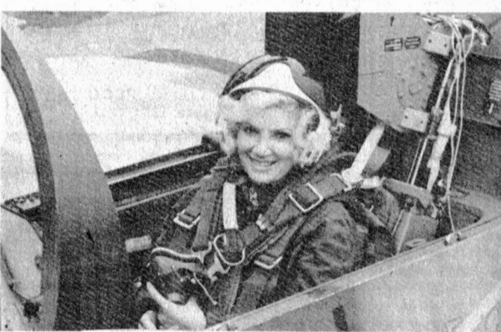
селя и очень контактная, отнюдь не выглядит неудачницей. И тем не менее я постаралась...