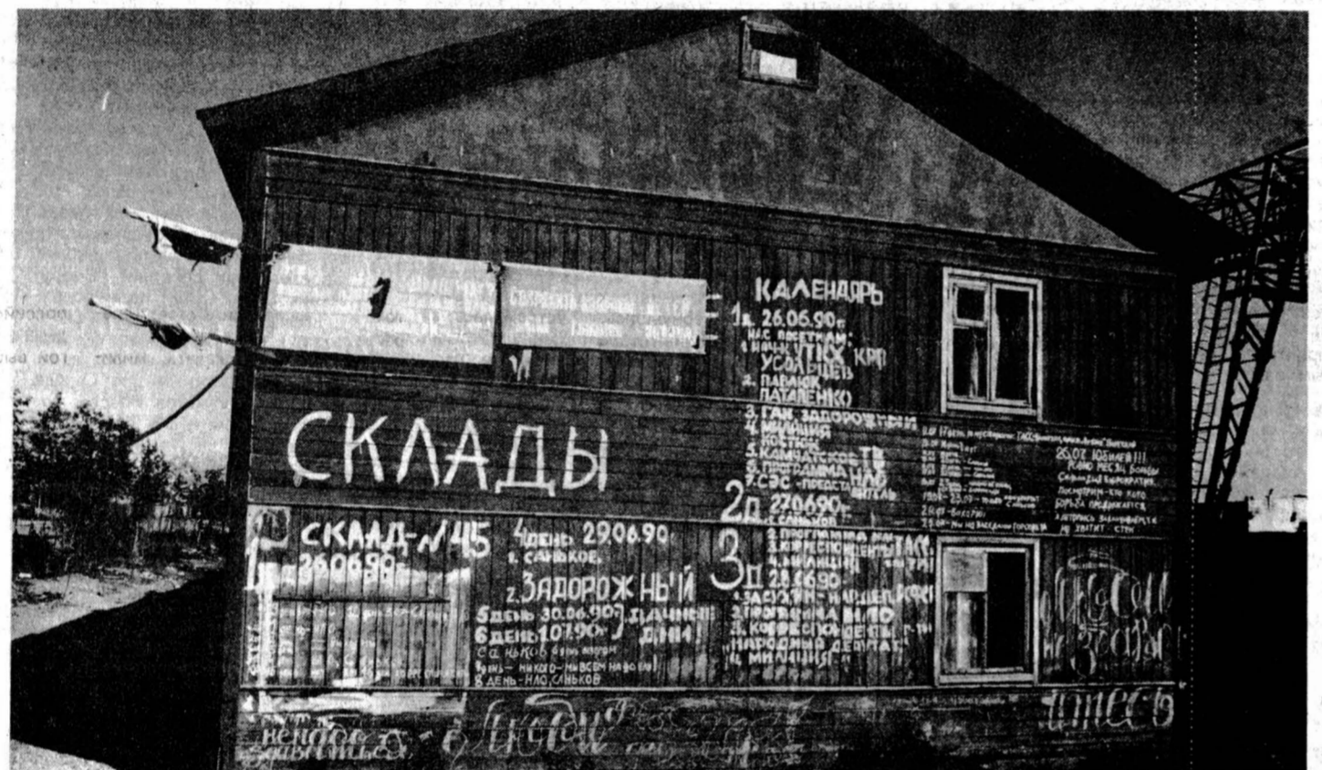
Письмо с Камчатки. В конверте фотография с подписью: «Стена этого здания — наш политический дневник».