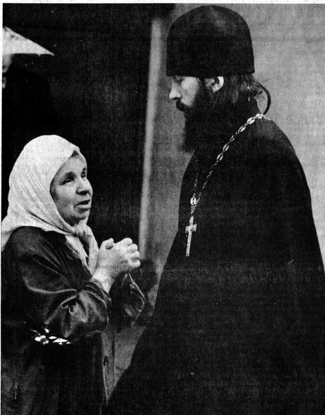
Слава Богу, есть еще те, кто умеет слушать.