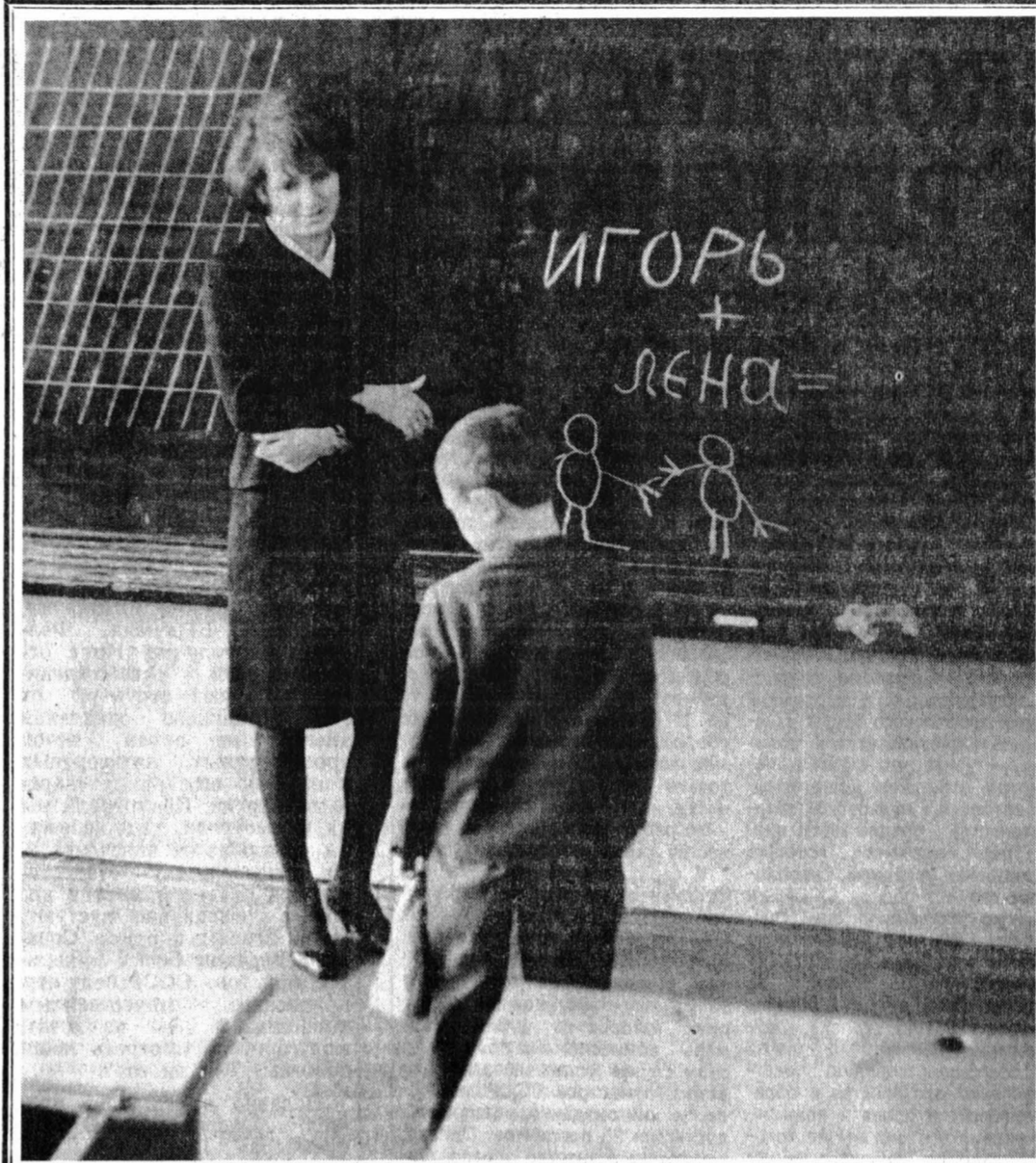
СНИМОК В КОНВЕРТЕ.

Сверху кладут компрессную бумагу и укутывают теплым шерстяным шарфом или пологотенем на ночь. После каждого компресса ткань (марлю) обязательно следует стирать с мылом и высушивать. Полностью избавиться от застарелого бурсита позволяет 20—25 ежедневных процедур. В редких случаях курс приходится повторять. Но непременно условием выздоровления является отсисывание гноя из сустава. Следовательно, спортсменам и артистам балета придется на время отказаться от своих занятий хотя бы на месяц... Полезно также напомнить, что компрессы из корня лопуха помогают и при других суставных болезнях — подагре, артрите, люмбаго, болях в конечностях, от трофических язв голени и ревматизме, а также от многих кожных заболеваний. Не расстраивайтесь, если на коже вдруг появится мелкая сыпь розового цвета. Это корень так «сигнализирует» об окончании курса лечения. Такая сыпь сама исчезает через день. Напомним еще: выпиваемый отвар из корня лопуха излечивает сахарный диабет и атеросклероз, камни желчного пузыря, отеки, водянку, язвы желудка и гастриты. А в последнее время в публикациях по фитотерапии появляется все больше сообщений о ярко выраженных противовоспалительных свойствах лопуха. Это хорошо согласуется с данными самой древней на земле тибетской медицины и недавними исследованиями американских фармакологов. Вот такой он, целебный репейник. А. АСТАПЕНКО, собиратель народных рецептов.