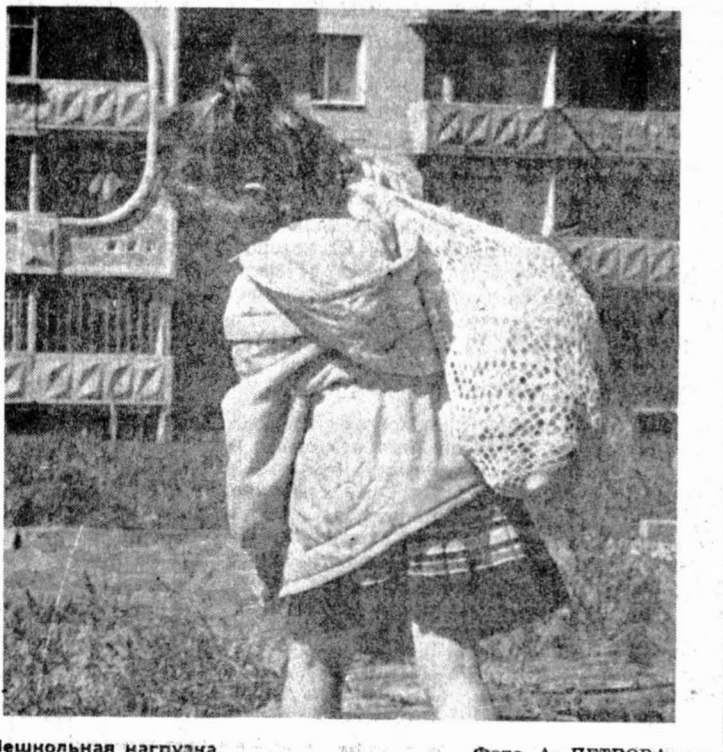
Нешлюжная нагрузка.