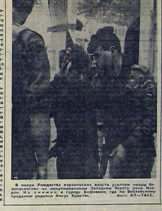
В канун Рождества израильские власти усилили меры безопасности, но оккупированном Западном берегу убиты 65 журналистов. В с. Иммине в городе Вифлееме, где по библейскому преданию родился Иисус Христос.