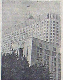
Путь поэтапного (квартального) формирования бюджетной системы Российской Федерации в 1992 году...