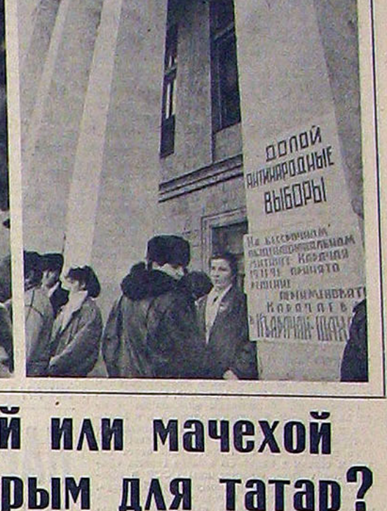
Возвращение крымских татар на свои исконные земли, в Крым, означает собой шаг нашего общества к гуманизму, правам человека, к нравственному очищению.

Если б я был президентом... Ю. ДРОБИШЕВ. Е. ГУТКИН. В. ОРЛОВ.