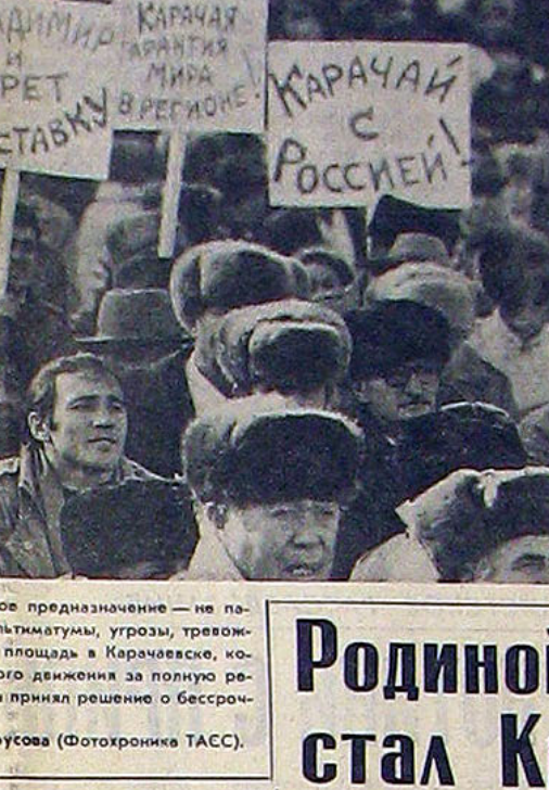
У наших площадей отныне новое предназначение — не парады и всеобщее ликование, а ультиматумы, угрозы, тревожное ожидание.

Второй — в процессах разединения и распада, в отсутствии доверия в России и ее национальной политике. Кроме того, с легкой руки режет из «Пам'ятки» с их одноклеточным патриотизмом дискредитирован сам термин «национальная идея».