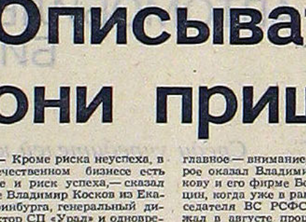
Северо-Западное управление государственного таможенного контроля СССР получило приказ организовать четыре таможни на границе с прибалтийскими республиками...