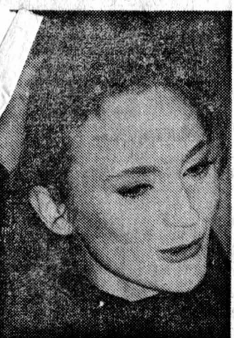
Мадемуазель Франция номер один вновь в Москве. Она приезжает сюда уже в третий раз...