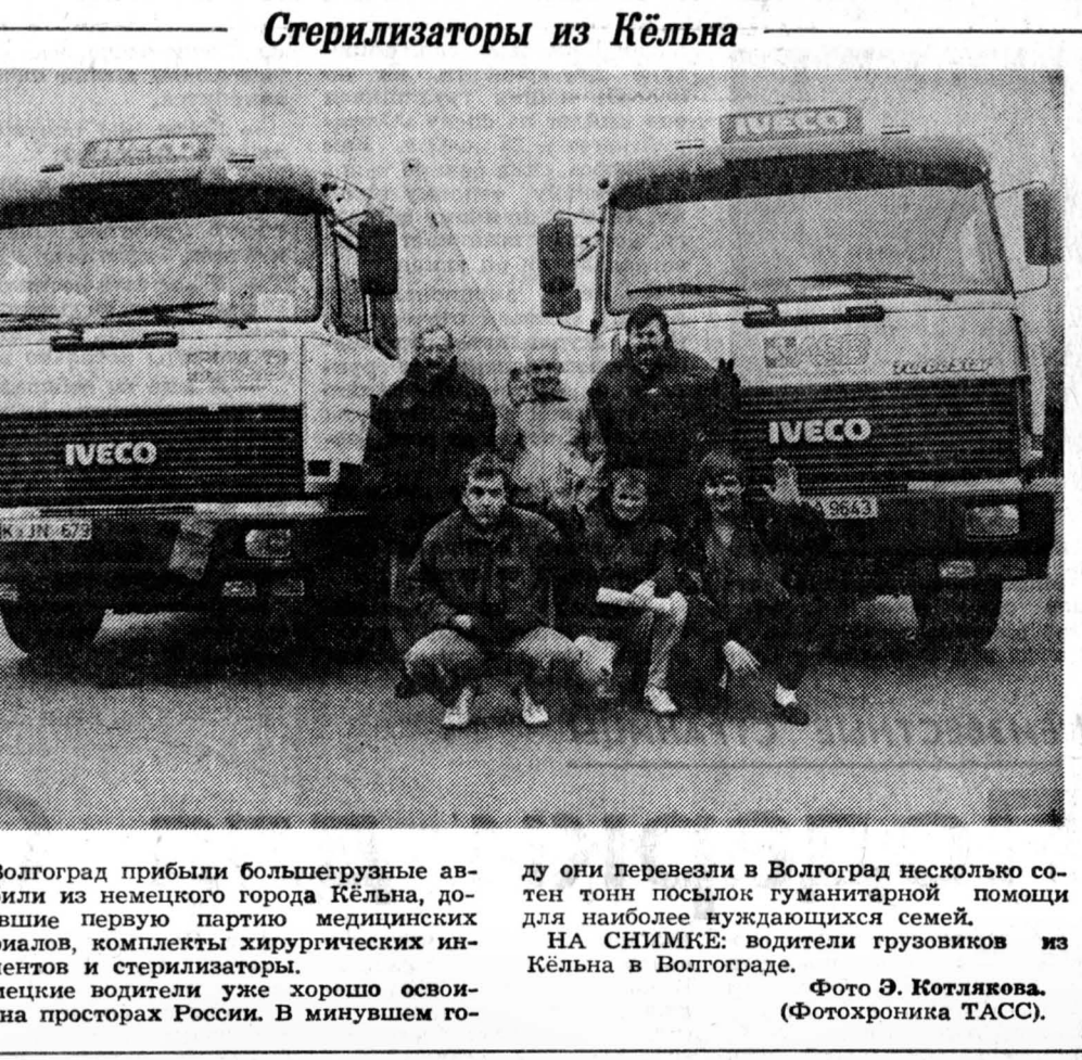
В Волгоград прибыли большегрузные автомобили из немецкого города Кельна, доставившие первую партию медицинских материалов, комплекты хирургических инструментов и стерилизаторы. Немецкие водители уже хорошо освоились на просторах России. В минувшем году они перевезли в Волгоград несколько сотен тонн посылок гуманитарной помощи для наиболее нуждающихся семей. НА СНИМКЕ: водители грузовиков из Кельна в Волгограде.

Спокутайся, если она у него была, Освальд унес с собой в могилу. Вскоре после убийства Дж. Кеннеди он сам пад от руки человека, разрядившего в него свой пистолет. Эй-би-си выражает сожаление, что ей не удалось скопировать и тщательно проанализировать досье из архивов КГБ. Впрочем, она надеется, что время для этого еще наступит. Последняя запись в досье, датированная 29 апреля 1964 года, гласит: «Дело имеет такое историческое значение, что уничтожению не подлежит».