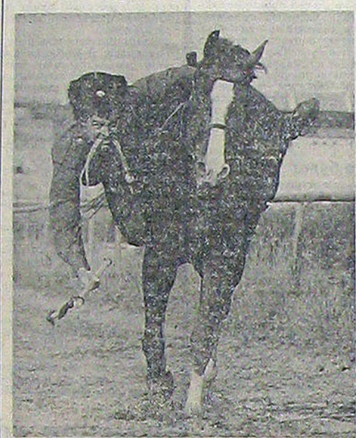
Ни один настоящий конноспортивный праздник не обходится без такой жригитовки. Ну, а если красавцев коней оседлала казачка... (Фотохроника ТАСС)