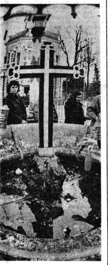
Духовный центр русской государственности...