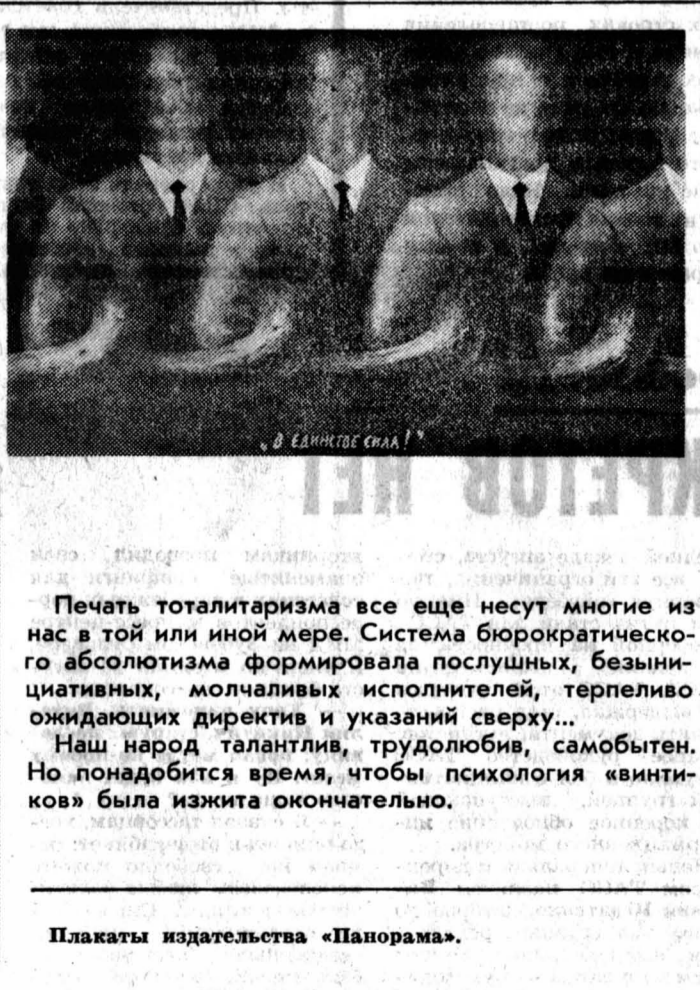
Плакаты издательства «Панорама».