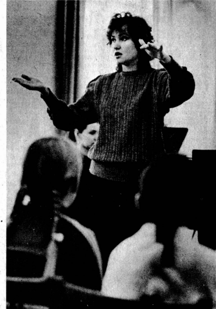
Душа обязана трудиться...

По сообщениям наших корреспондентов Владимир ГАЙДА, Валерий ГВОЗДИКОВ, Евгений БАБКИНА, «Сибинформ».